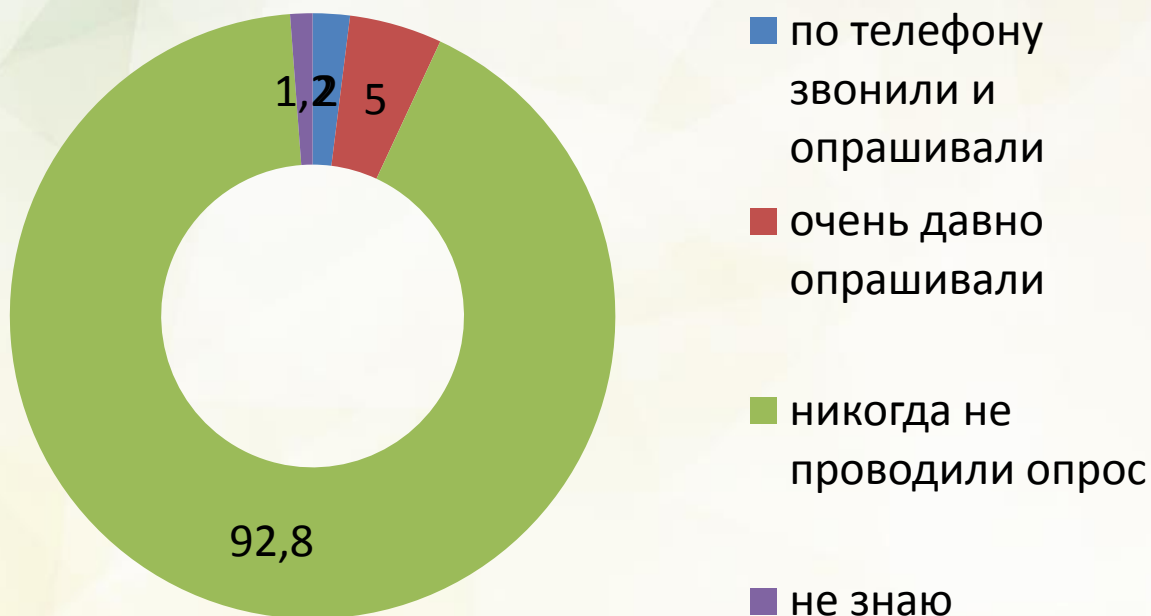
Опрос в %